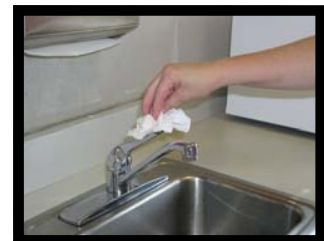
Apague el grifo con la toalla