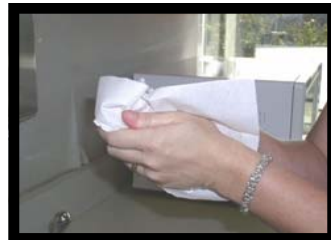
Seque con una toalla desechable