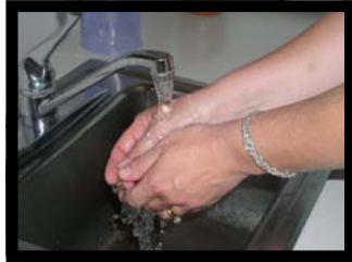
Mójese la manos