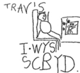
"I watched Scooby Doo."